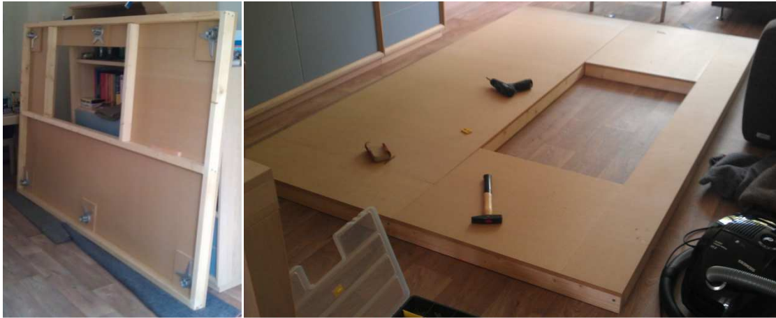
Boven- en onderaanzicht tafel

De tafel is opgebouwd uit een houten frame afgedekt met platen geperst hout. De poten zijn demontaal zodat de tafel gemakkelijk kan worden verhuist indien nodig.